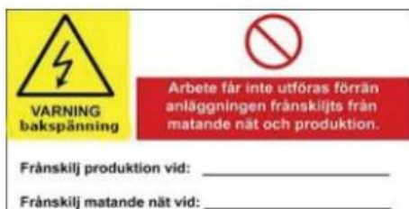
Figur 3: Exempel på skylt som varnar för bakspänning.